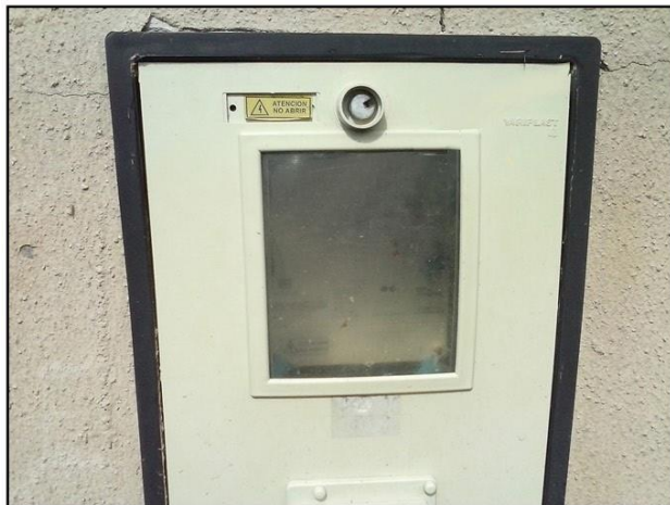
Medidor de Luz

Una vez aprobado el pilar puede solicitar el tipo de tarifa que utilizará.