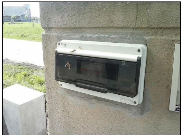
Caja IP 55 de 8 módulos