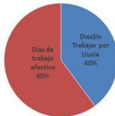
Trabajo Efectivo Vs Dias de Lluvia