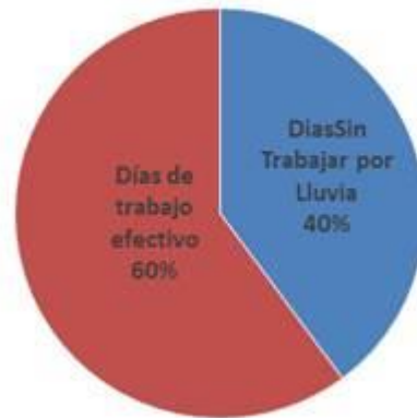
Trabajo Efectivo Vs Dias de Lluvia